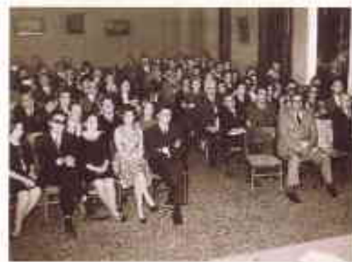
In prima fila: i premiati